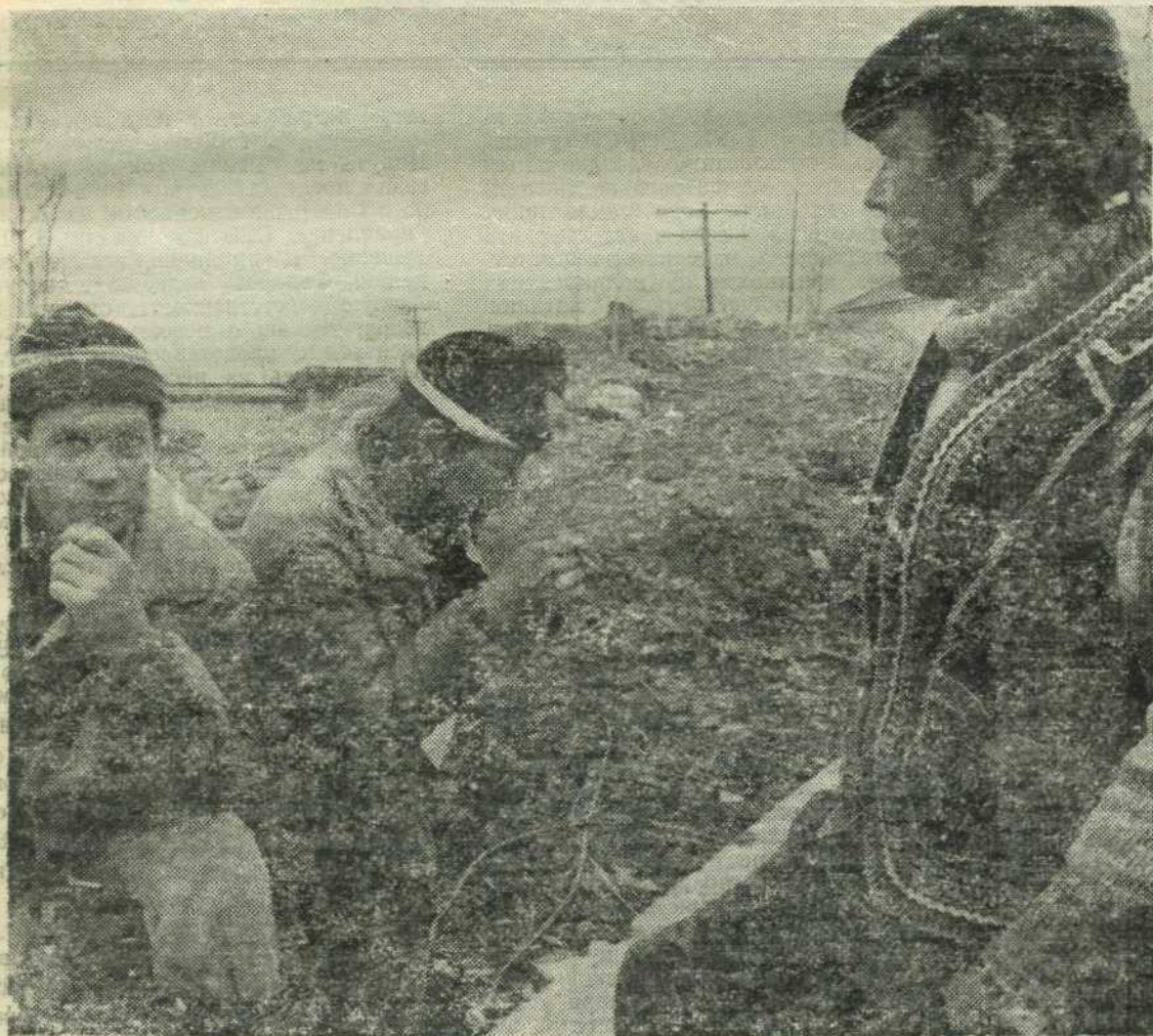
Что будем делать мужики?

400 килограммов сухого молока, присланных в Биробиджан из американского города-побратима Бивертон, безвозмездно переданы в центр реабилитации детей-инвалидов. Пока наши городские власти решают вопрос о том, что же из продуктов можно включить в месячный паек, положенный маленьким инвалидам, бивертонцы просто взяли и прислали для них отменное американское молоко.